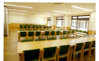
洋室はパーティションを開放して部屋続きで利用可能です。