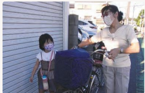
▲週に一度の習い事への送迎中は、おしゃべりも弾みます！

送迎場所により徒歩や車など必要に応じた方法で安全に送迎します。協力会員からは、ご自身のおさんと一緒に援助をすると、お子さんの新たな一面が見られることも多いとの声が寄せられています。