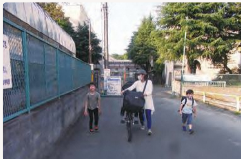
▲これから習い事に向かうお兄さんを応援するように、協力会員のおさんがランドセルを背負ってお手伝いしてくれました！

○習い事をさせてあげたいけど、送迎ができない、○残業で保育園の迎えに間に合わない、○子どもの通学・通園時間より早く出勤しなければいけない、○出産のため、上の子の保育園の送迎ができないなど