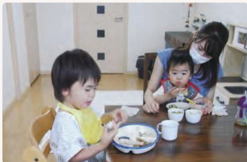
▲協力会員のお子さんとのランチタイム！一緒に食べると美味しいね☆

○病院に行きたいけど子どもを連れて行けない、○上の子の学校行事に参加したい、○在宅勤務に集中したいなど