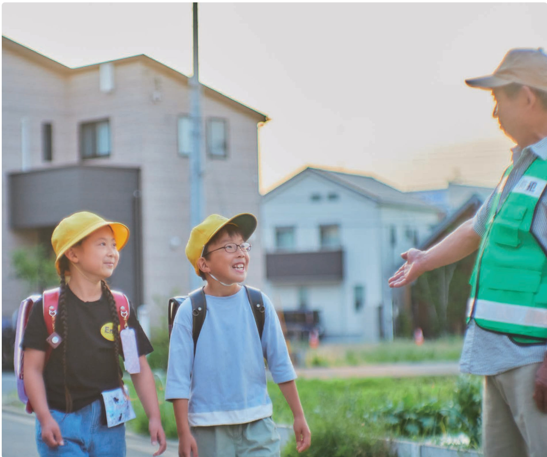
▲町内会は、子どもたちの登下校などを見守っています。(詳しくは、3ページをご覧ください)