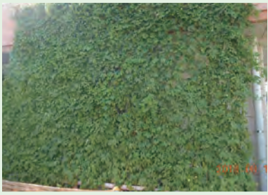
▲実践例 (第二老人福祉センター)

緑のカーテンとは、つる性植物を育て、夏の暑い時期に壁や窓をカーテンのように覆う取組です。植物の葉が直射日光をさえぎることと室温の上昇が抑えられたり、植物の蒸散作用で気温が下がったりするなど、地球温暖化対策として効果があります。