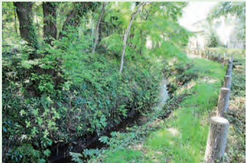
▲野火止用水 (野火止三丁目)

野火止用水にすんでいるコイやネズミは、水中の微生物や植物の種子など、自然界のものを食べています。餌を与えると、生態系を乱すだけでなく、ふん害や水路に穴を掘って護岸を崩すなど、人間にも被害が及びます。餌を与えず見守ってください。