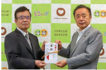
▲新座市商工会からコブシ福祉基金へ、10万円