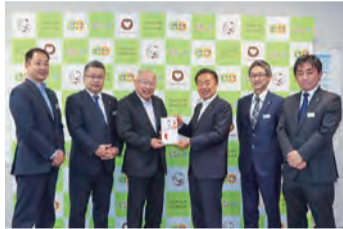
▲増木工業株式会社・株式会社増木工務店・株式会社増木・株式会社増木ホールディングスからグリーンスマイル基金へ、合計100万円