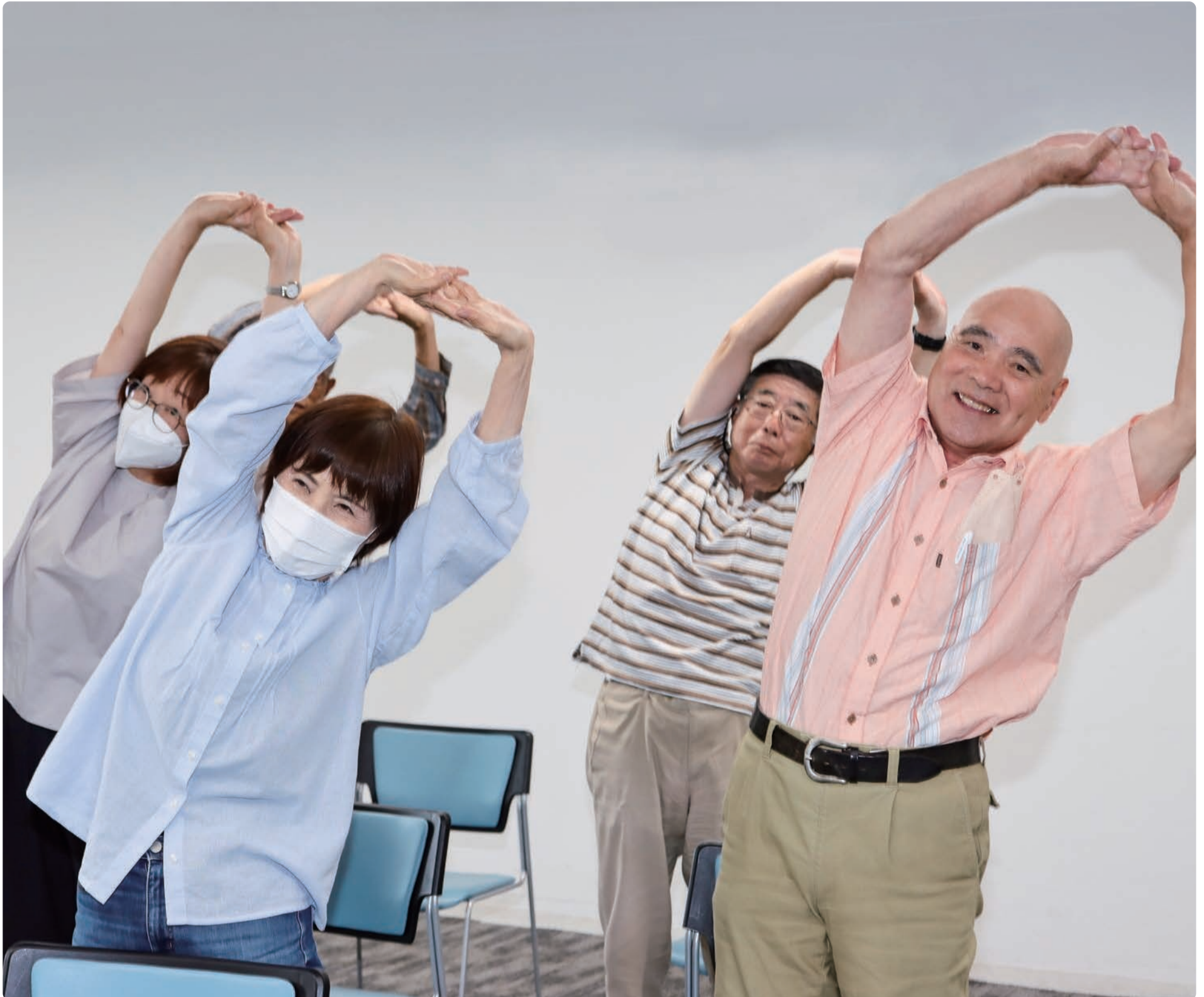
▲身体を動かしフレイル予防 (詳しくは3ページをご覧ください)