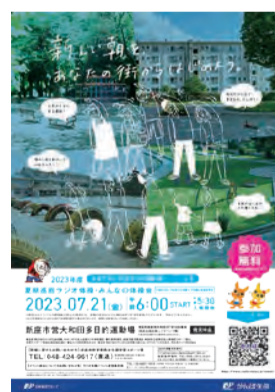
▲イベントポスター

▼日時／7月21日(金)、午前6時～6時45分(受付は5時30分～6時) (荒天中止) ▼場所／市営大和田多目的運動場 ▼主催／株式会社かんぽ生命保険、NHK、特定非営利活動法人全国ラジオ体操連盟 ▼共催／市、市教育委員会