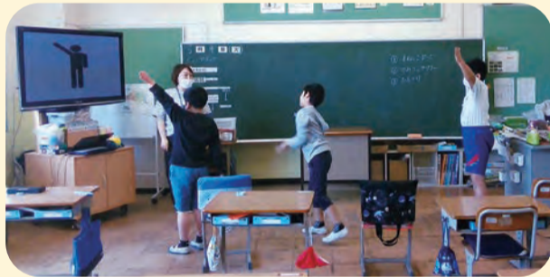
▲大型テレビで学習内容をイメージしやすくしています

障がいなど配慮が必要な児童生徒に対し、学習上や生活上の困難を克服するために設置された少人数の学級です。市では全校に特別支援学級を設置しています。