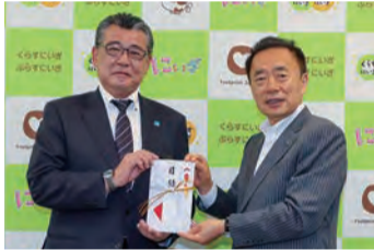
▲株式会社ヨーコーから市(市営墓園)へ、焼香台2台(10万円相当)