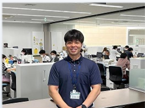
令和4年度入庁 総務部人事課