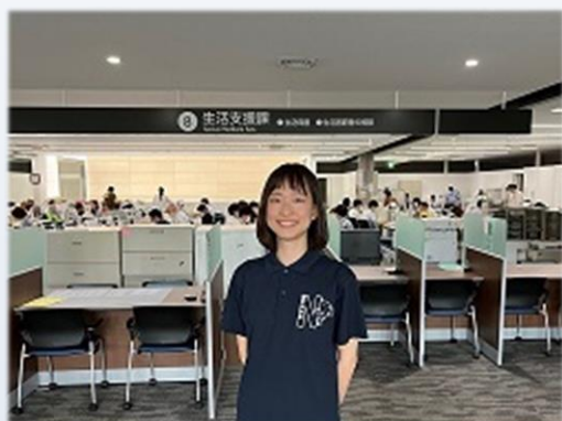
平成30年度入庁 総合福祉部生活支援課