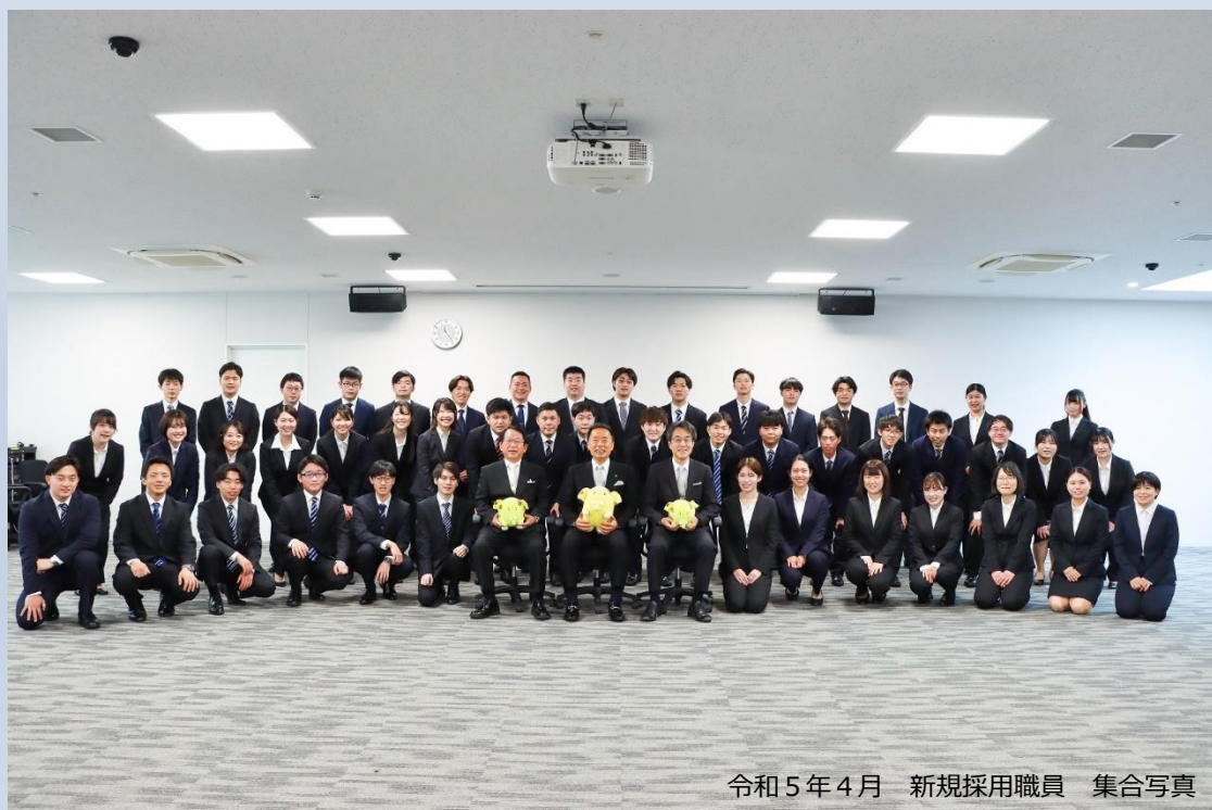
令和5年4月 新規採用職員 集合写真

市民のために働きたい、新座市をより良くしていきたいという熱意を持った方のご応募をお待ちしています！