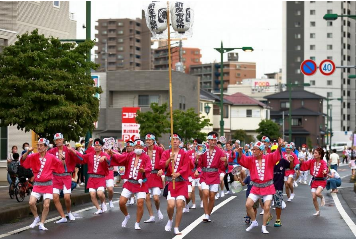
新座快適みらい都市第7回大江戸新座祭り