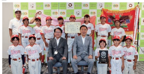
女子学童軟式野球の新座ガールズが市長を 訪問し、県予選大会で優勝、NPBガールズト ナメント2023全日本女子学童軟式野球大会に 出場することを報告しました。