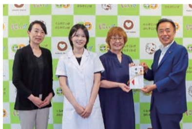
▲株式会社かくの木から新座グリー ンスマイル基金へ、62,440円 (同社が運営している4つの薬局で レジ袋を廃止し、代わりに紙袋を販 売した売上)