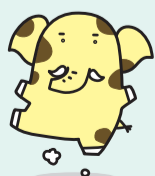
▲新座市イメージ キャラクター 「ソウキリン」