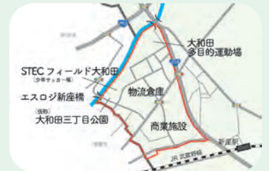
▲大和田二・三丁目地区土地区画整理事業