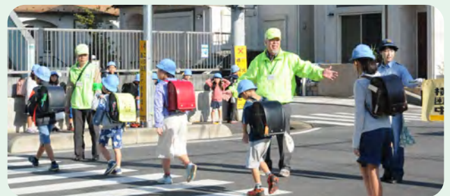
▲町内会による登下校の見守り活動

市内では町内会やPTA、企業など多くの自主防犯パトロール団体が活動し、地域の安全を支えています。