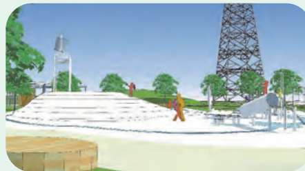
▲(仮称)大和田三丁目公園(完成イメージ)