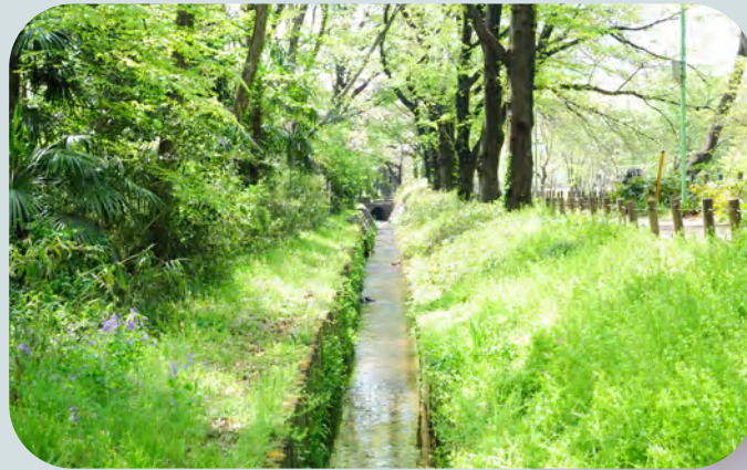
のびとめようすい 📍野火止用水 (埼玉県指定史跡)

まつだいらいずのかみのぶつな 江戸時代に松平伊豆守信綱によって開削された用水路。清流と緑を楽しめる遊歩道があり、ウォーキングコースとして親しまれています。