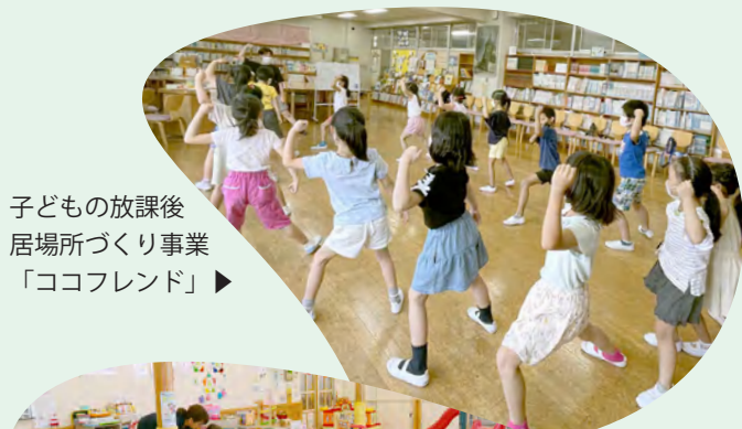
子どもの放課後 居場所づくり事業 「ココフレンド」▶

また、誰もがいきいきと自分らしくいられるために、健康づくりや介護予防の取組の推進、障がい者やその家族を支援する基幹相談支援センターの機能を充実させるなど、地域で支え合う社会づくりを目指します。