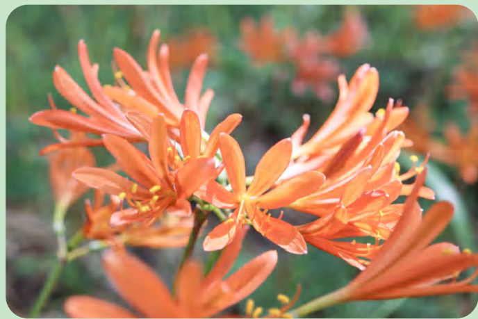
キツネノカミソリ