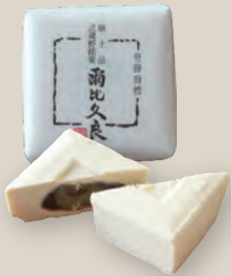
▲にいくら 爾比久良