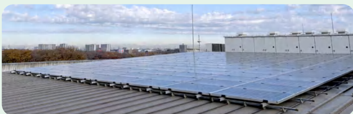
▲市庁舎に設置している太陽光発電設備

また、町内会などの地域活動への支援や、農業・商業・工業などの地域経済の振興を図り、賑わいと自然環境が調和する地域づくりを目指します。