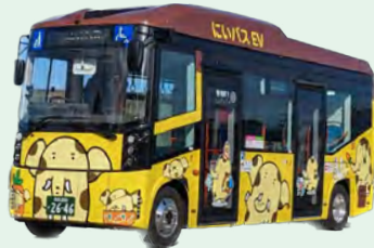
▲コミュニティバス (にいバス)