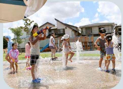
📍新座セントラル キッズパーク

夏にはじゃぶじゃぶ池も楽しめる公園。子どもたちが思い切り水遊びできる人気のスポットです。