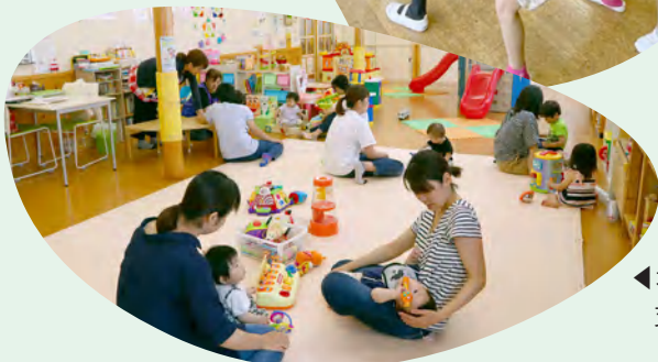
◀地域子育て 支援センター