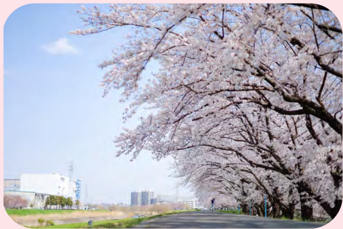
柳瀬川遊歩道の桜