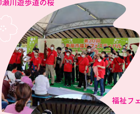
福祉フェスティバル