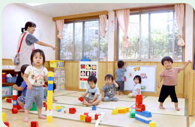
▲保育園で元気に遊ぶ子どもたち