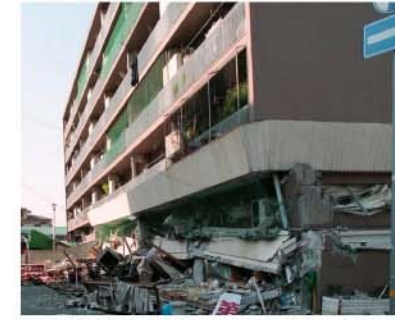
阪神淡路大震災で被災した集合住宅